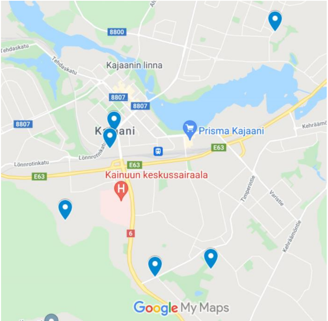
Liite 1. Tapahtuma-alueiden sijainti kartalla